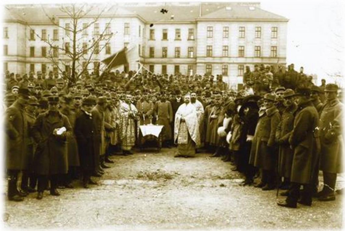
Sfintirea drapelului Consiliului Național Român- Viena