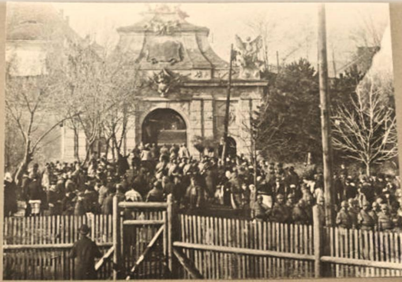
11.) Armata română a Maestăzii Sale Regelui Ferdinand I. al României în Alba-Iulia la 19 Decembrie n. 1918.