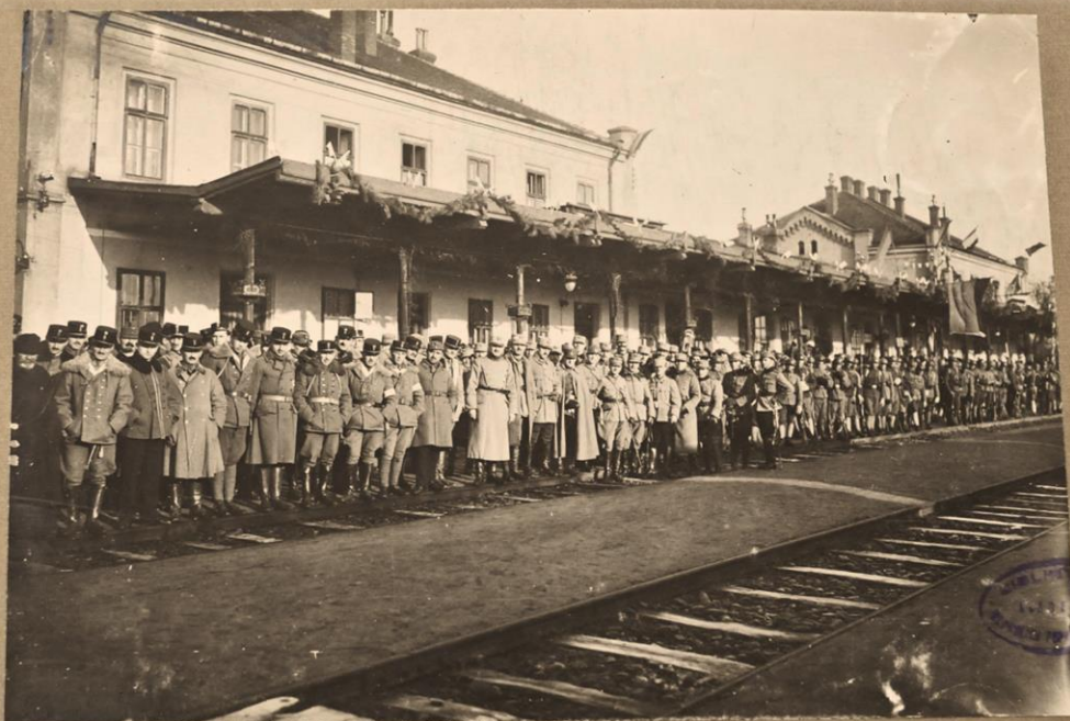
15.) În așteptarea trenului. — Oficerii Români așteaptă sosirea D-lui general Berthelot la Alba-Iulia în 1 Jan. n. 1919.

În așteptarea gen. H. Berthelot-1 ianuarie 1919