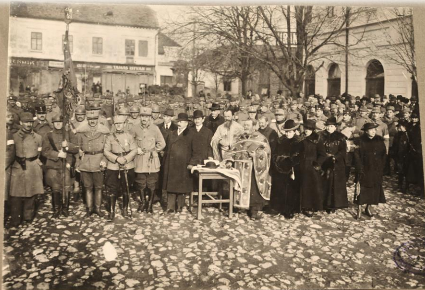
13.) Sfințirea steagului Jandarmeriei Române în Alba-Iulia la 28 Decembrie n. 1918 în prezența Reg. 5 de Vânători cu drapelul dela măreșeț.