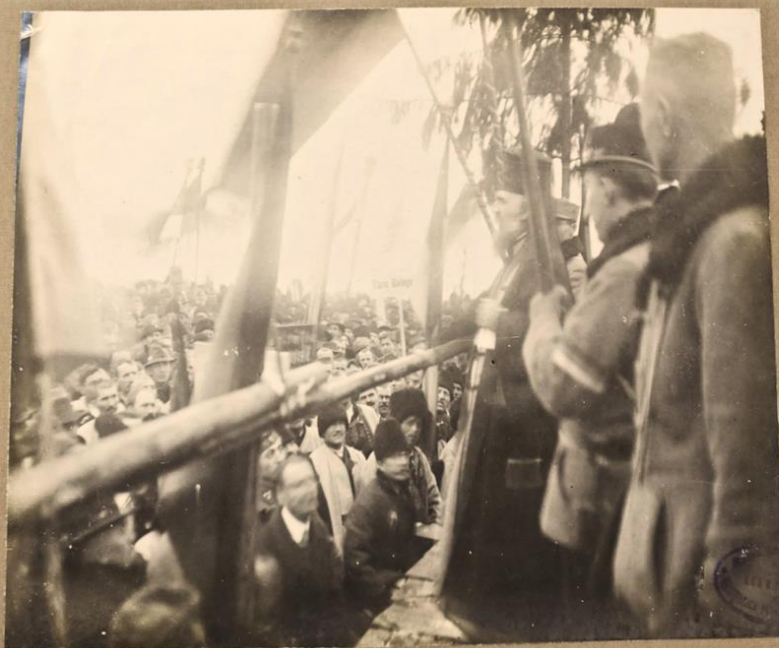
4.) Vorbirea P. S. S. episcopul Caransebeşului Dr. Miron E. Cristea către poporul din »Tara Hategului« şi jur în Alba-Iulia la 1 Decembrie n. 1918.