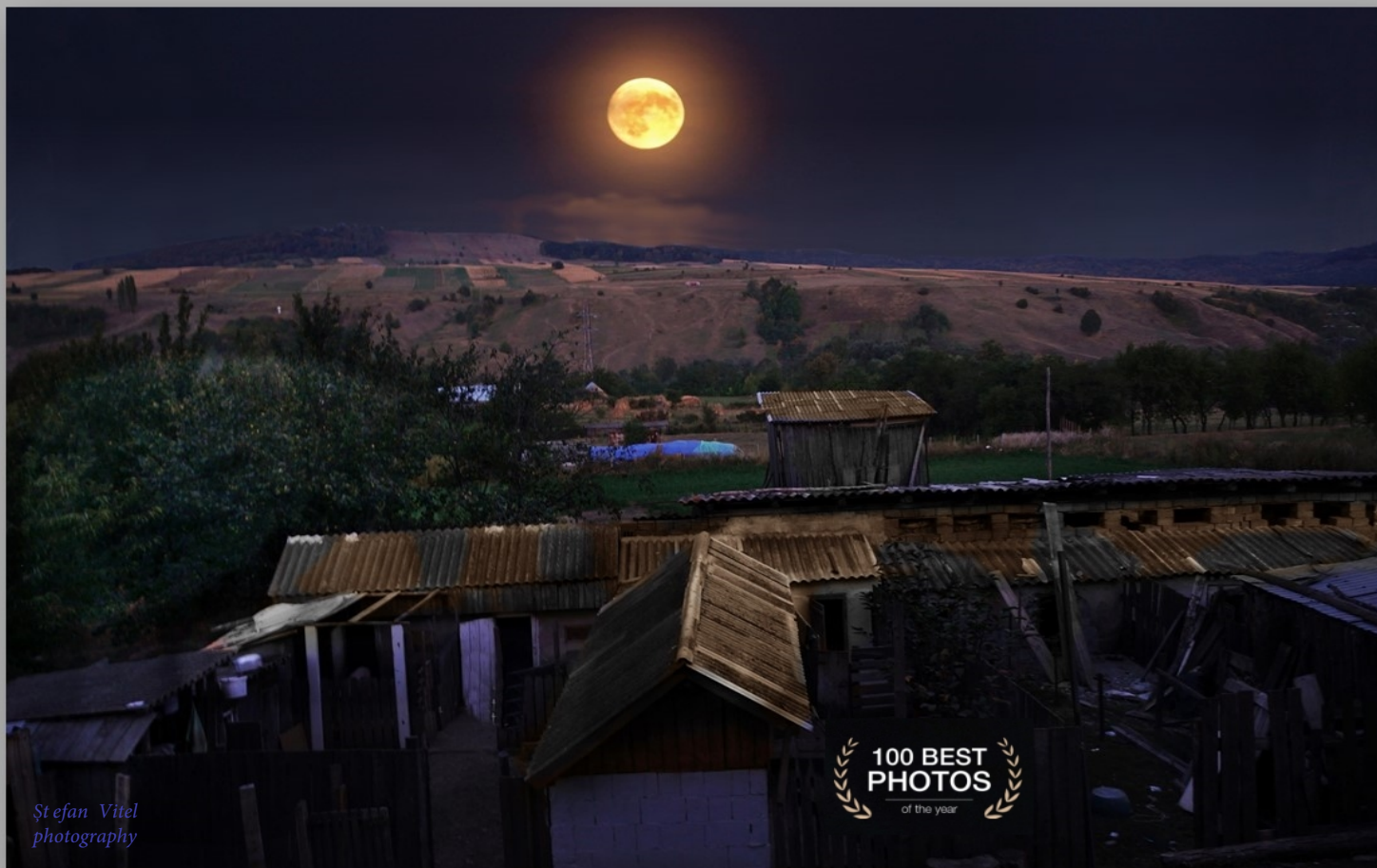
Fotografii premiate la concursul „35Award ” în 2018 și în 2019